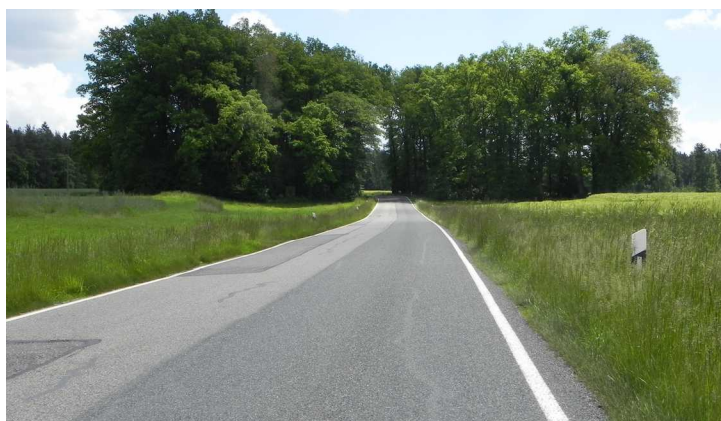
Bild 3: Südlicher Ortsausgang von Sperberslohe Richtung Allersberg